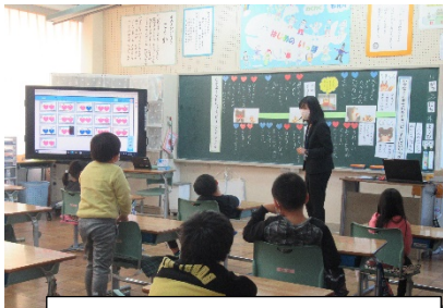
1年生 道徳公開研究会

これからの予測不可能な時代に生きる子どもたちには、探究的な学習や体験学習を通じ、子どもたち同士で、あるいは多様な他者と協働する力を身につけさせることが必要です。本校でも、これまでの実践だけでなく、様々な学びの形を取り入れながら知・徳・体のバランスのとれた教育活動の展開を目指します。