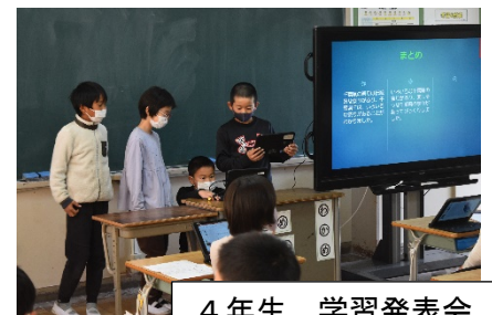
4年生 学習発表会 社会科