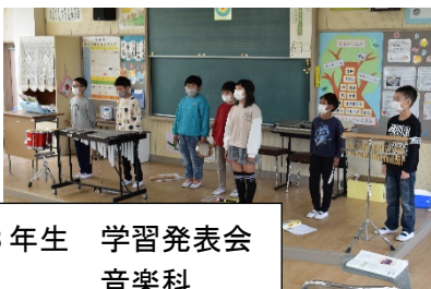
3年生 学習発表会 音楽科